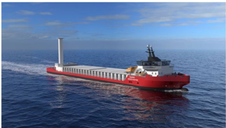
Vard Zeroocean. Konsept for et bulkskip uten utslipp og med Flettner-rotor som utnytter vind til framdrift og elektrisk selvsossemaskin på traversplattform. (Illustrasjon: Vard)

Heidelberg Cement og Felleskjøpet har satt seg hårete mål: I 2023 skal de frakte korn og stein langs norskekysten uten utslipp. Nå har 31 rederier sagt at de vil bygge skipet.