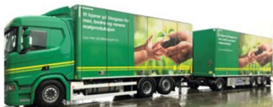
Biogass - HVO