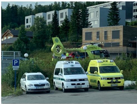
OMKOM: Mannen i 70-årene ble sendt til UNN etter drukningen på Senja. Her døde han søndag.