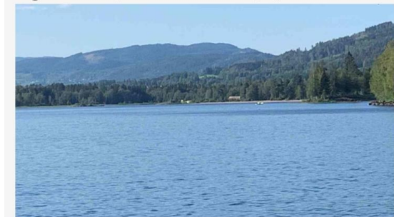
En 35-åring druknet i Hurdalsjøen lørdag.

35-åringen skulle på båttur. Den endte fatalt for familiefaren.