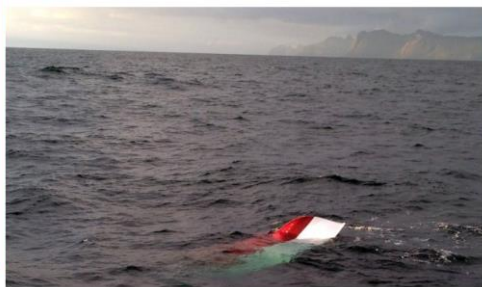
KANTRET: Den 19-fots åpne båten til Bekrene ble funnet kantret ved Måneset fredag kveld.