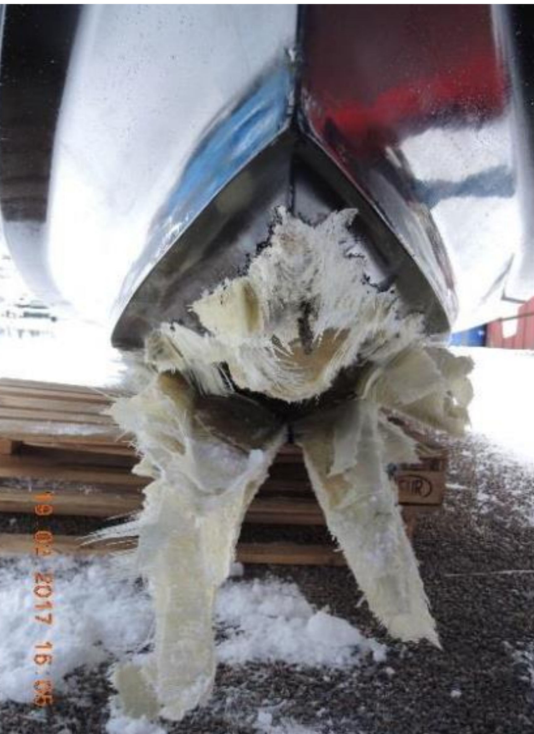
Figur 6: Skader på fartøyets baug (t.v) og skader på akterspeilet (t.h).