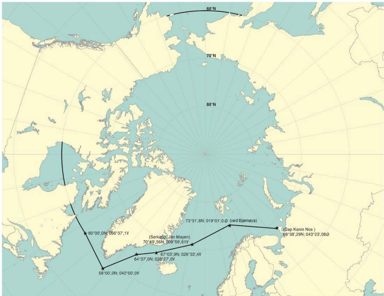
Figur 2 – Maksimum utbredelse av anvendelse i arktiske farvann 3